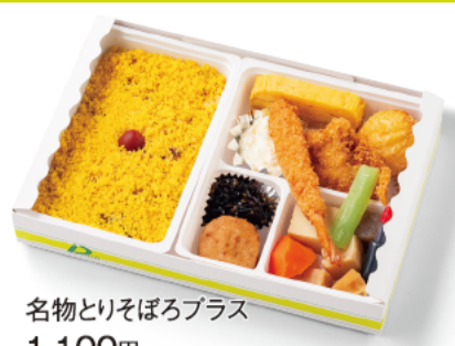
名物とりそばろプラス 1,100円(税込)