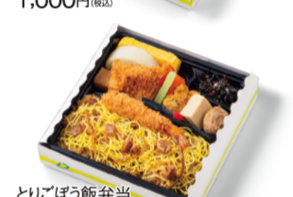
とりごぼう飯弁当 1,000円(税込)