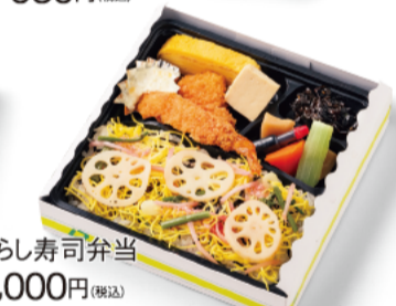
ちらし寿司弁当 1,000円(税込)