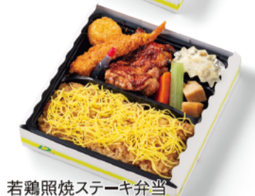
若鶏照焼ステーキ弁当 1,050円(税込)