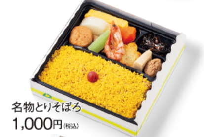
名物とりそばろ 1,000円(税込)