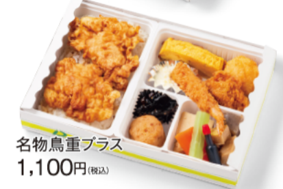
名物鳥重プラス 1,100円(税込)