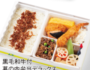
黒毛和牛付幕の内弁当デラックス 1,380円(税込)