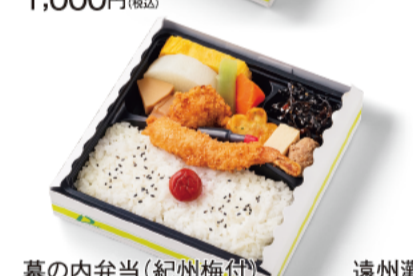
幕の内弁当(紀州梅付) 1,050円(税込)