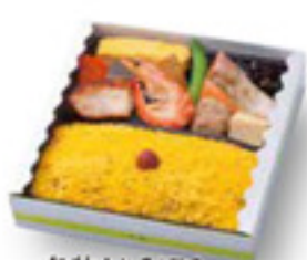
名物とりそばろ 880円 税込

*3,000円以上のご購入で無料配達とさせていただきます。 当サイトからのご予約は前日正午までをお願い致します。 3,000円未満のご購入は店頭でのお引渡しとなります。