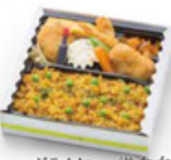
ドライカレー洋食弁当 890円 税込