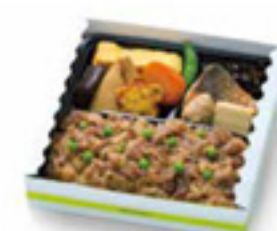
黒毛和牛牛めし弁当 1,200円 税込