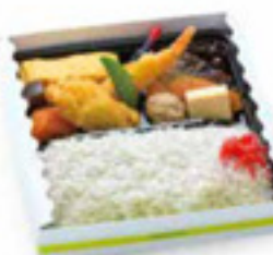
遠州灘しらす弁当 980円 税込