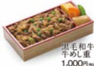
黒毛和牛牛めし重 1,000円 税込