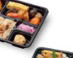
鳥重プレート 630円 税込

お電話1本で無料配達 TEL.053-436-0080 FAX.053-430-4881