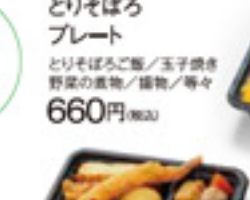
とろそばろプレート とろそばろご飯/玉子焼き 野菜の漬物/漬物/等々 660円 税込