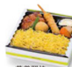
若鶏照焼ステーキ弁当 980円 税込