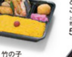
竹の子ご飯プレート 竹の子ご飯/玉子焼き 野菜の漬物/漬物/等々 520円 税込