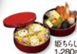
姫ちらし二段重 1,280円 税込