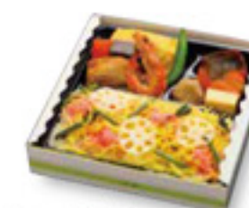
ちらし寿司弁当 900円/1,090円 税込 *写真は500円のお弁当です