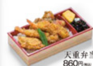
天重弁当 860円 税込