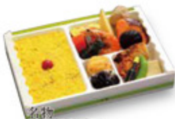
名物とりそばろプラス 1,070円 税込