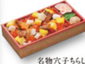
名物穴子ちらし重 1,200円 税込