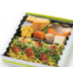
鯉まぶし弁当 1,450円 税込