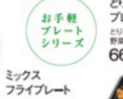
ミックスフライプレート エビフライ/玉子焼き 野菜の漬物 特製がトウモロコシ とりの唐揚げ/等々 550円 税込