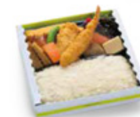
鯛めし弁当 1,000円 税込