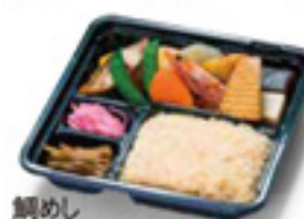
鯛めし健康弁当 鯛めし/煮海老/あじの塩焼き 漬物/きんぴらごぼう/等々 750円 税込 481 kcal