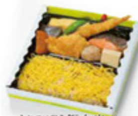
とりごぼう飯弁当 870円 税込