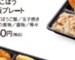
とりごぼうご飯プレート とりごぼうご飯/玉子焼き 野菜の漬物/漬物/等々 550円 税込