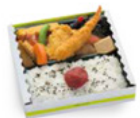
幕の内弁当(紀州梅付) 950円 税込