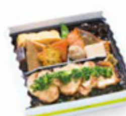
焼鳥弁当 1,000円 税込