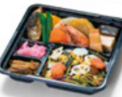
ちらし寿司健康弁当 ちらし寿司/煮海老塩焼き 漬物/きんぴらごぼう/等々 750円 税込 499 kcal